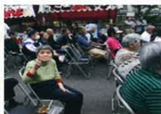
地域、ご家族、ボランティアと一緒に