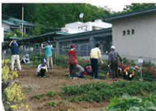
一人ひとりに合わせた日中活動と余暇活動