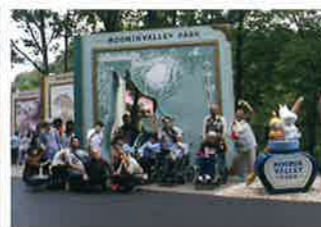
一人ひとりが主役の行事、旅行、ドライブ